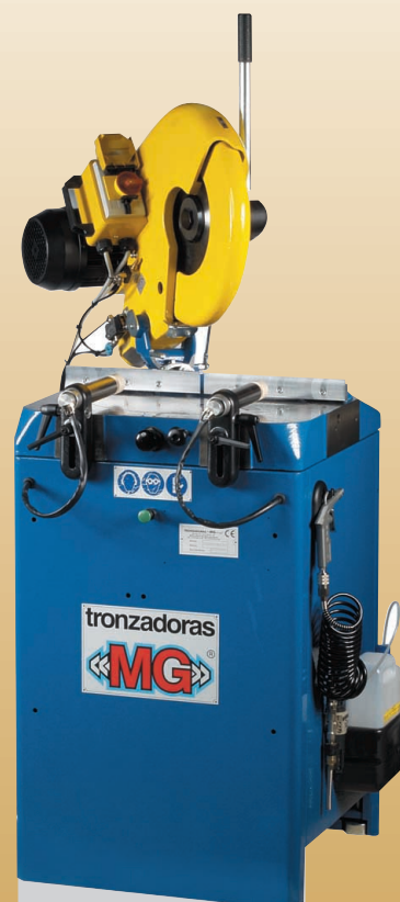
Máquina de Corte Descendente

Recolhida: 2.300 x 1.600 mm Estendida: 4.000 x 2.600 mm